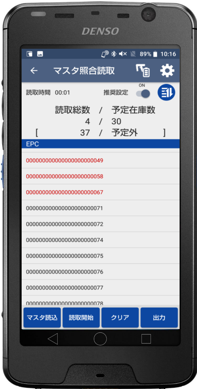
マスタ照合 (棚卸) モード